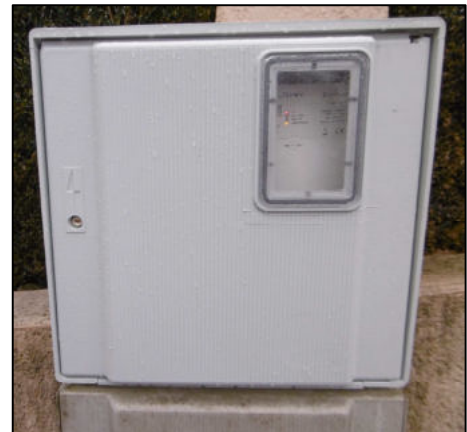
Répéteur LINKY à Dardilly