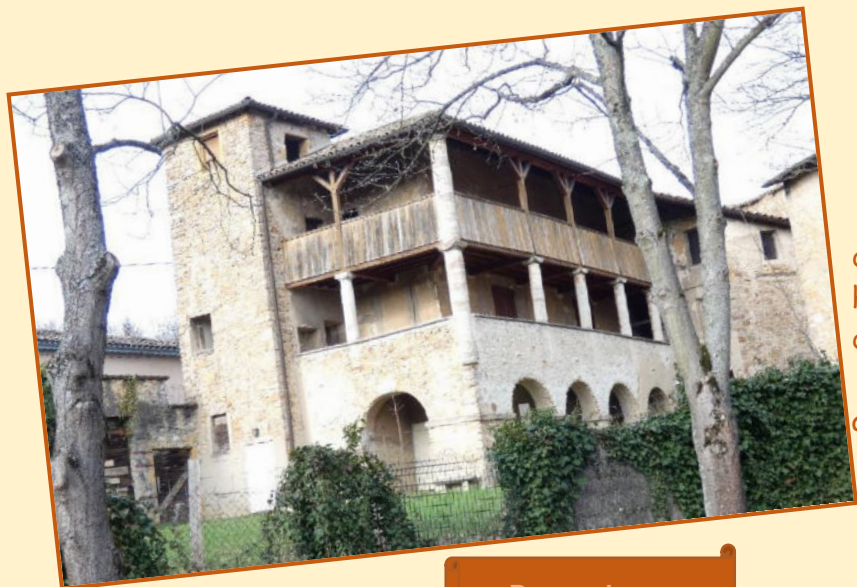
De nos jours