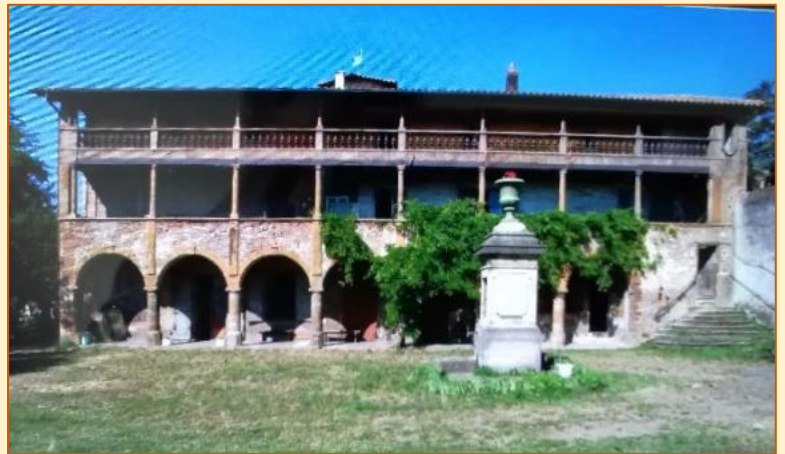
Château du Petit Perron

Le manoir est donc intéressant et remarquable à plus d'un titre, c'est un trésor pour Dardilly.