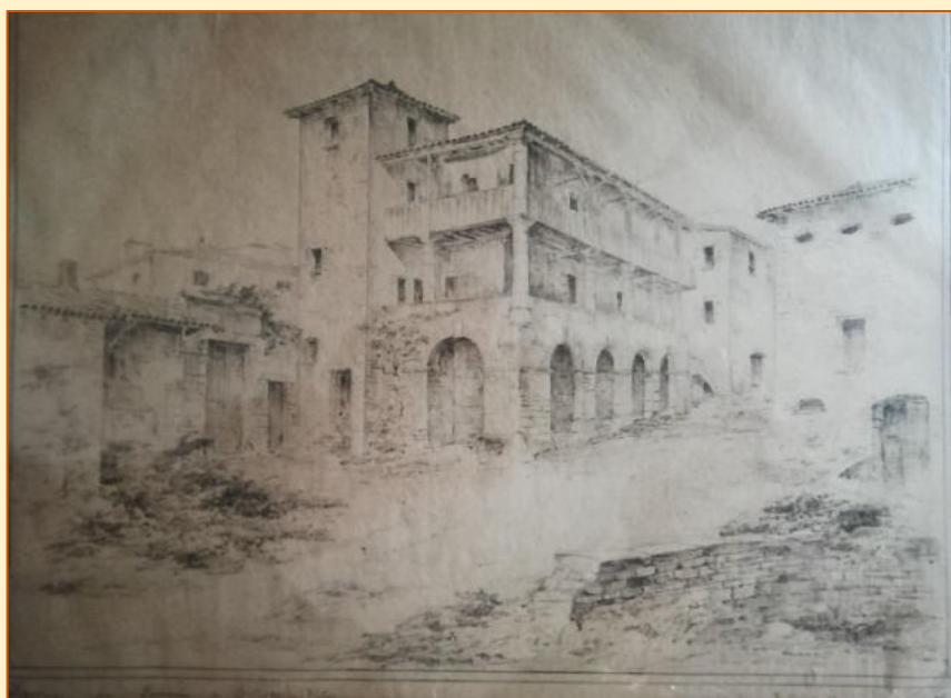
Gravure d'Amédée Cateland, fin XIX ème

Cette maison a évolué dans le temps, s'est agrandie et au XVII ème est devenue une "maison des champs", propriété d'échevins lyonnais. Elle se singularise par une architecture florentine à double galerie et les peintures murales qu'elle renferme, témoignent de l'intérêt de ses propriétaires pour les arts.