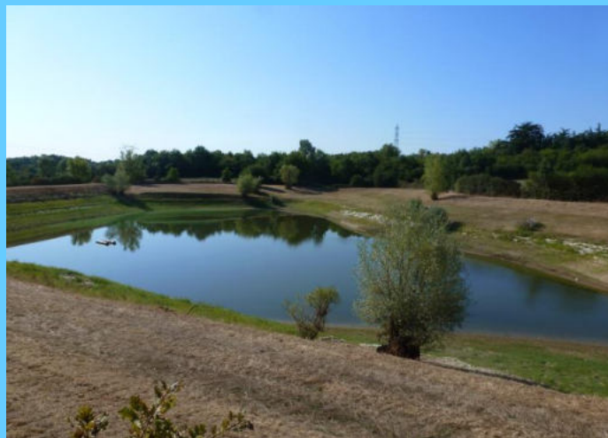
Etang de la Brochetière

Même si ce n'est pas le but d'un Classement, il a un effet indéniable : c'est l'augmentation de la valeur des propriétés bâties de la commune et tout particulièrement de celles situées non loin de la zone classée qui donne une garantie pour un environnement, naturel ou cultivé, préservé. Indirectement cela profite aussi aux terrains à bâtir des zones urbanisées compte tenu de l'image offerte par la commune qui tient lieu de label de qualité de vie.