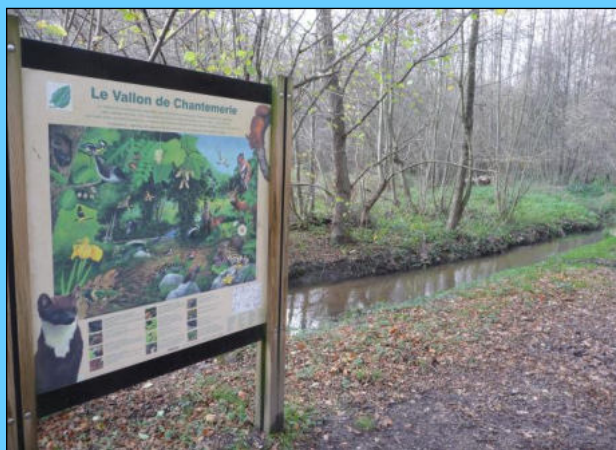
Vallon de Chantemerle

A noter que l'avis défavorable à un Classement émis par la Mairie de Dardilly est en opposition avec les orientations environnementales adoptées depuis plus de 20 ans telles que définies en particulier dans la Charte de l'écologie urbaine du Grand Lyon, le SCoT ou encore les PENAP.