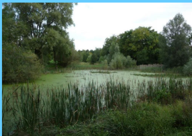
Vallon de la Liasse

2015 Consultation des collectivités territoriales concernées. En octobre, le Conseil municipal de Dardilly émet un avis défavorable au principe de Classement. DEA réagit auprès de la DREAL.