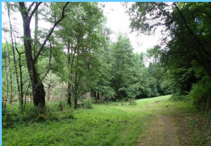
Vallon des Planches