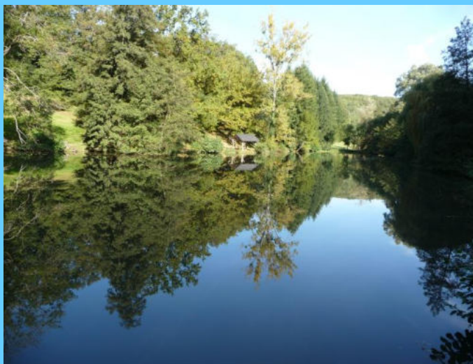
Bois de Serres - Etang Fond Jacou

Le Classement d'un site pittoresque remarquable a pour ambition de le préserver de toutes atteintes graves susceptibles de nuire en particulier à ses caractéristiques paysagères et environnementales.